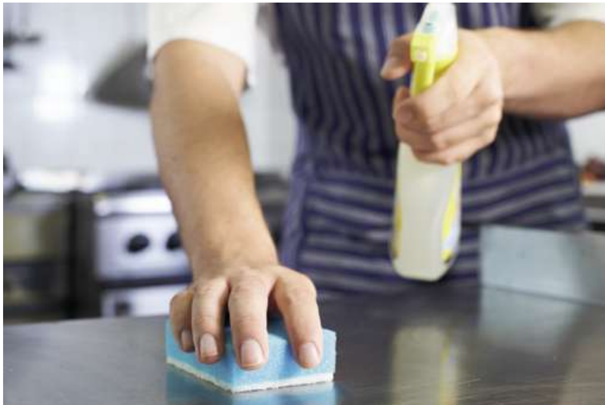
La sanificazione di un piano di lavoro.

Affrontiamo con il nostro esperto, pasticciere, gelatiere, chef, titolare con la famiglia della Pasticceria Racca di San Bartolomeo al Mare, Im, e direttore di Gelato Pastry University di Carpigiani a Tokyo, un tema di stretta attualità: la pulizia e la sanificazione del locale . È importante fare il punto dopo circa un anno di pandemia per vedere quali sono, a ragion veduta, le soluzioni più efficaci per mantenere pulito e gradevole il punto vendita.