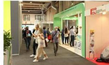
Issa Pulire. Visitatori nei padiglioni di Verona fiere

«Il momento è particolare», afferma Giuseppe Riello, presidente di Afidamp. «Questi due anni di Covid», spiega, «hanno segnato tutti e il settore del cleaning non fa eccezione. Anzi, il comparto delle macchine per la pulizia professionale è stato soggetto a un'ulteriore pressione dovuta all'impennata della richiesta di sanificazione dei locali aperti al pubblico e, in generale degli uffici e dei siti produttivi delle imprese. Stiamo puntando sulla formazione e sull'informazione, dati i continui aggiornamenti imposti dal mutevole panorama legislativo in ambito sanitario». Riello