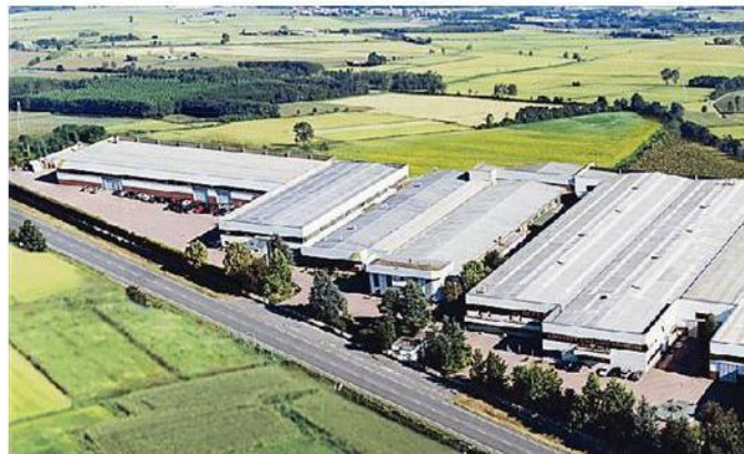
Lo stabilimento della Ghibli & Wirbel a Dorno, dove è presente dal 1968