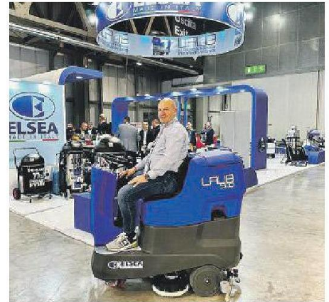
NOVITÀ La lavapavimenti uomo a bordo con asciugatura