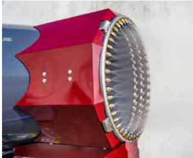
Cannone sparanebbia a 120 bar Made in Italy. Si avvale di una tecnologia sicura e certificata.

c'è stato quando abbiamo costituito la nostra prima azienda in Cina.”